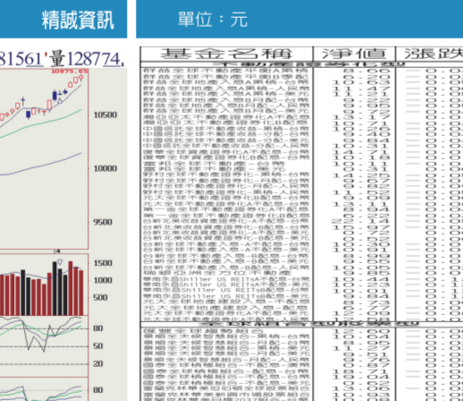
集市中場加權指數日線圖