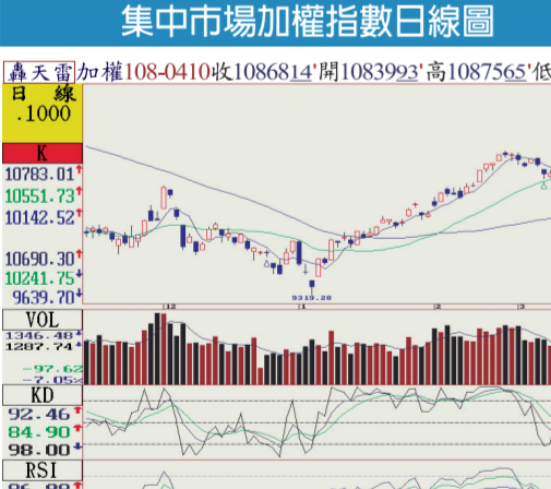
集市中場加權指數日線圖